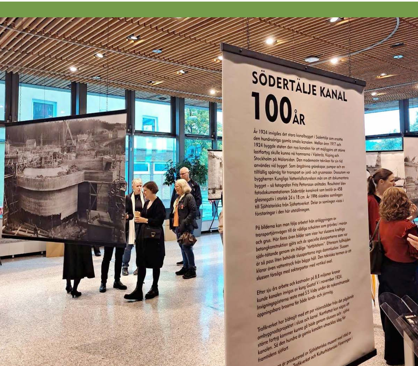
I oktober invigdes fotoutställningen Södertälje kanal 100 på Södertälje Stadshus. Den visar delar av fotografen Fritz Petterssons fotodokumentation av det stora kanalbygget i Södertälje 1917–1924 som finns i Sjöhistoriska museets samlingar. Fotografierna kan även ses digitalt på DigitaltMuseum .